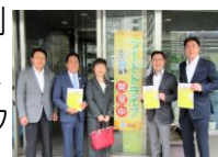
みなとリサイクル清掃事務所にて

区議会公明党提案の、食品ロス削減のために、家庭で余った食品を、必要とする人たちに寄付する「フードドライブ」常設窓口が開設!